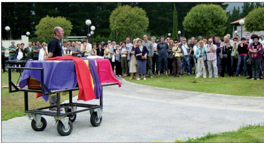
GOIENA KOMUNIKAZIO TALDEA

Interes horren ondorioz, hileta zibilak suspertzen ari dira, Olaizolaren aburuz. Baina eraikitze-lanetan daude oraindik;