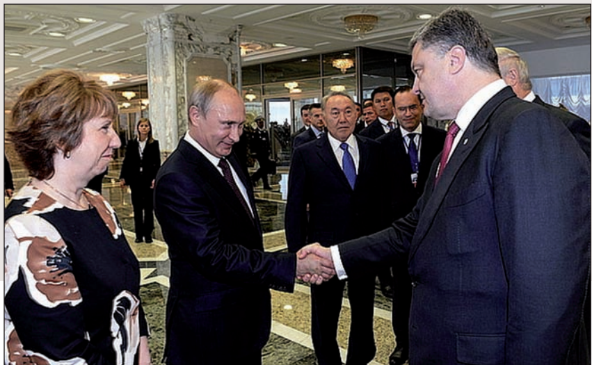
Vladimir Putin eta Petro Poroxenko elkarri bostekoa ematen abuztuaren 26an Bielorrusiako Minsken burutu gailurrean, bitartekari-lekuko dauzkatela, Europar Batasunaren kanpo arazoetarako komisario Catherine Ashton eta Kazajstango lehendakari Nursultan Nazarbaiev.

Hedabideok 1914-19ko gerraren mendeurrenarekin jira eta buelta gabiltzan garaiotan hain deigarri ez zen egiten aditu bat baino gehiagok