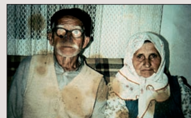
Bosnian Déjà Vu. Goiuri Aldekoak Europako hirugarren herrialde pobreenean egindako irudiak.