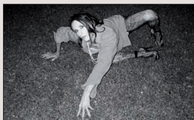
Cabanga. Godzilla. Bilbotarraren lana azokan izango da ikusgai, ekainaren 10etik 29ra.