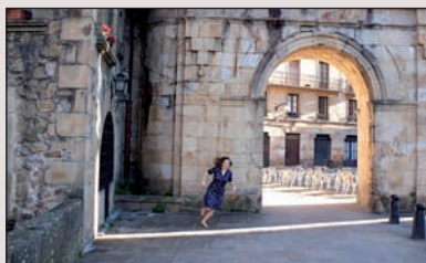
Desplazamiento. Garazi Erdaide durangarrak oroimenaren kontzeptua esploratzen du, eta horren erlazioa argazkiekiko.