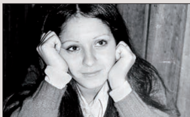
Perdida. Rous Boisier txiletarrak memoriaren galtzea landu du bere amaren bidez: "Bere baitan zegoela, ulertzen eta zaintzen saiatu nintzen".