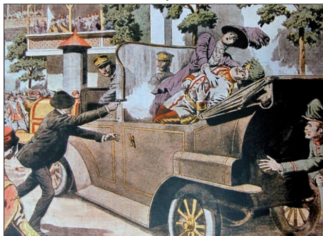
LE PETIT JOURNAL

1914ko ekainaren 28ko Sarajevoko atentatua gerra abiarazteko aitzakia hutsa izan zen, metxa piztu zuen txinparta.