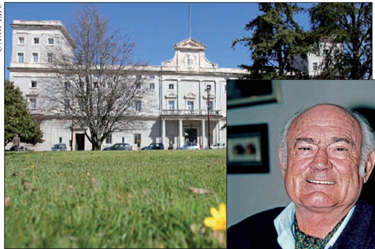
Goian, Nafarroako Unibertsitatea (Opus Deirena). Eskuineko argazkian, Moncada.