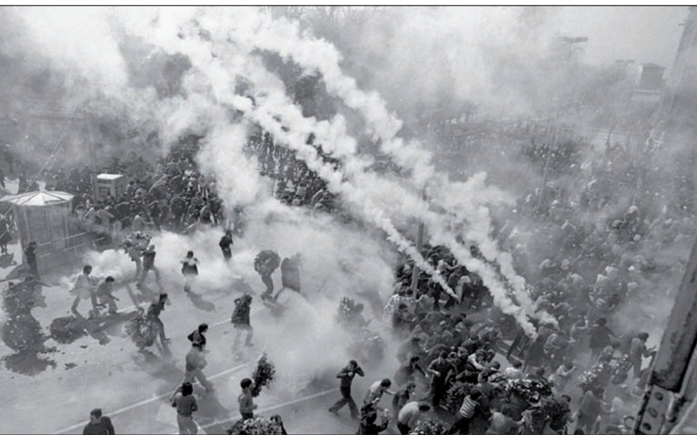
1976ko martxoaren 3a, Gasteiz. Greba orokorra zela eta, milaka langile bildu ziren San Frantzisko elizan, Zaramaga auzoan. Poliziak eliza ingurua hesitu eta gogor erreprimitu zituen asanbladan bildutakoak. Bost lagun hil zituen.

Francoren diktadura amaiturik, eta trantsiziora bidean, 1977ko hauteskundeak bukaerarik gabeko ezta-