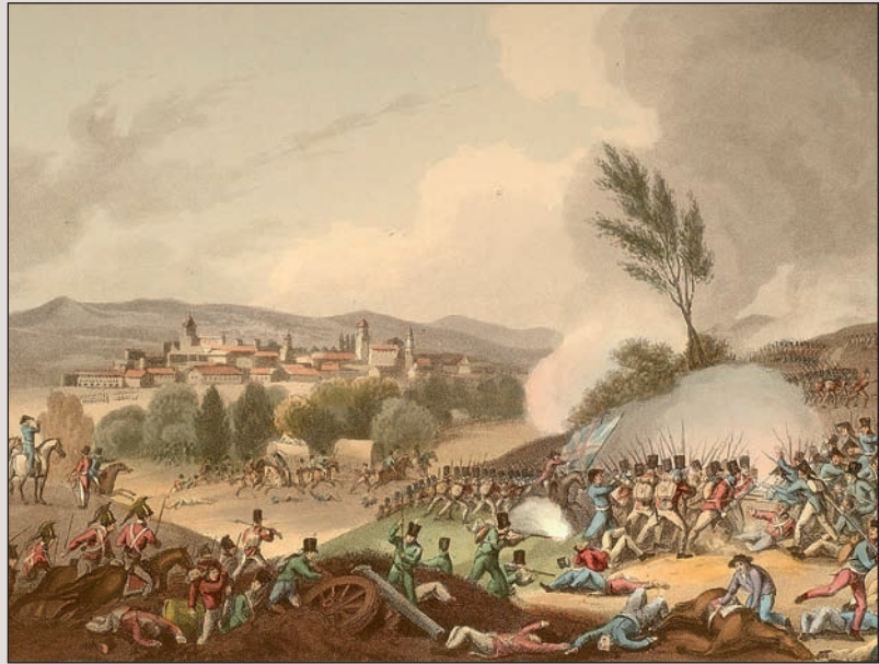
KOLDO MITXELENA KULTURUNEA

Gasteizko gudua Arabako lautadan jokatu zen 1813ko ekainaren 20 eta 21ean. Bi aldeetan hildako asko izan ziren, gehiago tropa napoleonikoen artean. Baina zibilen kontra ez zuten errepresaliarik hartu. Hori bai, arpilaketa izugarria izan zen, gure lurraldean aurrekaririk gabekoa. Gudua irabazi ondoren Wellingtonek ez zuen esperotako espolioa egiterik izan. 275.000 libera inguruko balioa zuten ondasunak bildu zituen, baina altxorrik preziatuenak, hala nola Rafael, Velázquez, Tiziano, Rubens edo Zurbaranen ehunka koadro, frantziarrek eraman zituzten –gerora aliatuek berreskuratuko zituzten arren–. Soldaduei nahi adina arpilatze baimena eman zien jeneralak; Gasteiz eta inguruak doako azoka erraldoi bihurtu ziren tropentzat. Herritarrek ahal zutena soinean eramanda, presa-ka, alde egin zuten, eta bidean gehienek ondasun eskas horiek