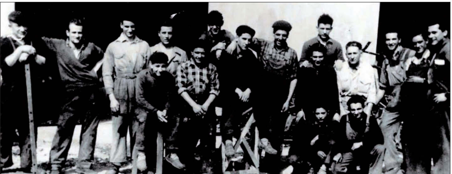
Irizarreko langileak 50eko hamarkadan. Enpresak kooperatiba sortzeko bi arrazoi nagusi ikusi zituen: langileak beste enpresetara ez joatea eta inbertitzeko kapitala eskuratzea; bazkide bakoitzak 50.000 pezeta jarri zituen.

tako Gipuzkoako nagusiaren irudi bereizgarria osatu zen, langile autodidaktarengandik askoz hurbilago dagoena langilearen errealitatea guttiz arrotza zaion enpresaburuarengandik baino”.