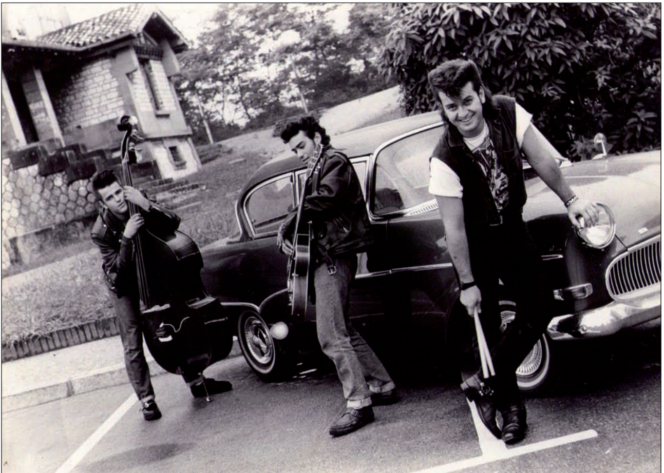
Temblores rockabilly taldea, Antzaranen.

ADIN JAKIN batetik gorako gehientsuenek ezagutzen dute Irungo Mosku. 80ko eta 90eko hamarkadak puri-purian bizi izan zituztenen bilgune esanguratsua izan zen ofizialki Urdanibia plaza dena, kontuan hartu