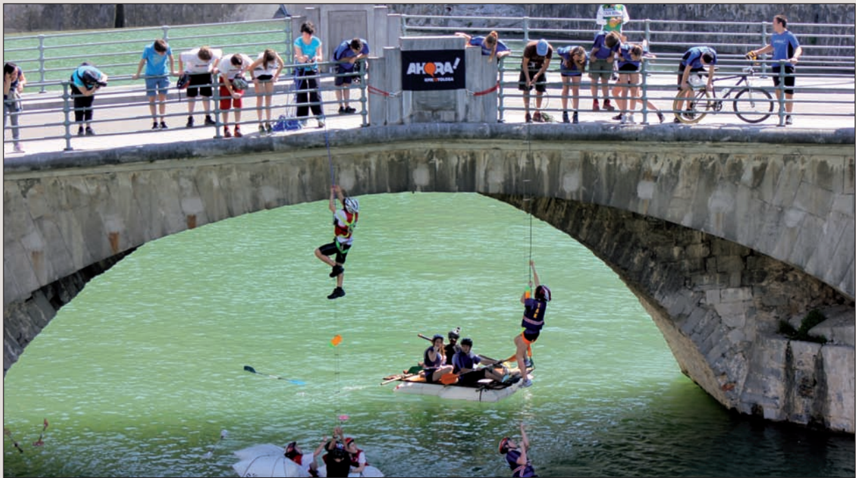
Erronka abentura lehiaketan alde fisikoa, irudimena eta adimena landuko dute gazteek. Irudian, probetako bat.

Baina Erronka hori ez da Lasakorain ikastolak duen bakarra, izan ere, beharrak eraman du aurtengo ikastolen jaia antolatzera. Azken urteetako matrikulazio kopurua hazi egin da eta duela urte batzuk Sakramentinoen eremua erosi eta ikastola egokitu zuten. Maileguei esker egin zituzten lan haiek eta zorrak kitatzea dute orain helburu.