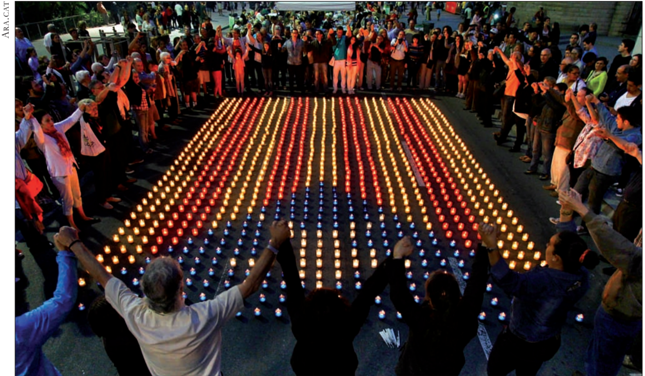
Azken hilabeteotan kandlekin osatutako estelada argiztatuak osatu dituzte ehunka herritan. Irudian, Bartzelonako Familia Santuaren tenplu aurrean egindakoa.

DIADAREN EGUNERAKO ekitaldi ikusgarria antolatu dute Kataluniako Biltzar Nazionalak (ANC) eta Òmnium Cultural elkarteak. Ebrotik Pirinioetara luzatuko den giza kate handia egingo dute milaka lagunek,