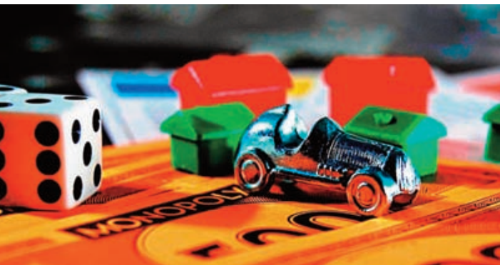
ENDYR'S TOY BOX

Ipar Euskal Herriak ez du bere beharrei erantzuten dien ordenamendurik. Kanpotik ezarririkoa den heinean, dinamika kaltegarriak eragiten ditu. Zentzu horretan, zonalde euskaldunenak dira pobreenak, zahartuenak, baliabidez urriena... Iparraldeak bere lurraldea arautzeko eskumenik ez duen aldetik, hegoaldearekin dituen balizko kointzidentzia estrategiakoak garatzerik ez dauka. Ezin ditu sinergiak baliatu.