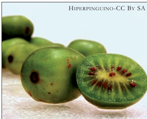
Actinidia arguta , koktel kiwia.