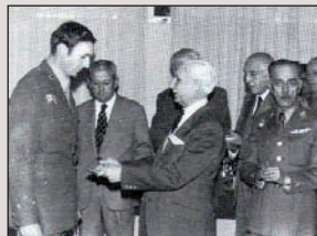
1976an domina jasotzen.

Argazkien aferaren ondoren Donostiara bidali zuten; bertan sadismo berarekin jipoitu zituen atxilotuak.