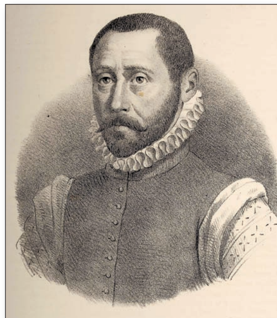
Esteban de Garibairen 1868ko grabatua. Tubalen mitoa zabaltzen lehenengotako kronista izan zen.