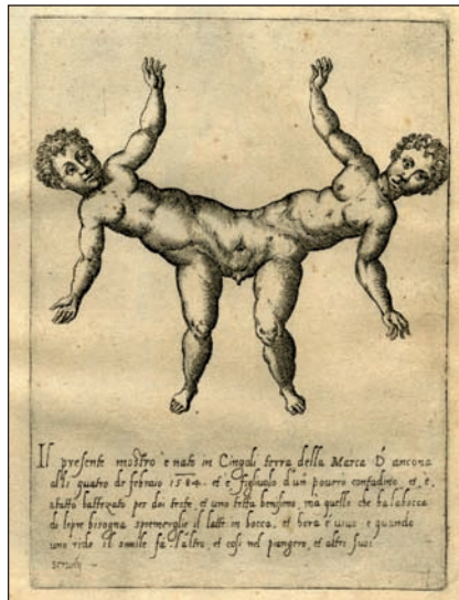
Fortunio Liceti italiarraren De monstis (1665) liburuko ilustrazioa. Garai bertsuan, Licetik "munstroak" deskribatu zituen eta Fatiok siamdarrak bereizteko ahalegina egin zuen.

Basileako udal gobernua kontseilu berezi baten eskuetan zegoen garai