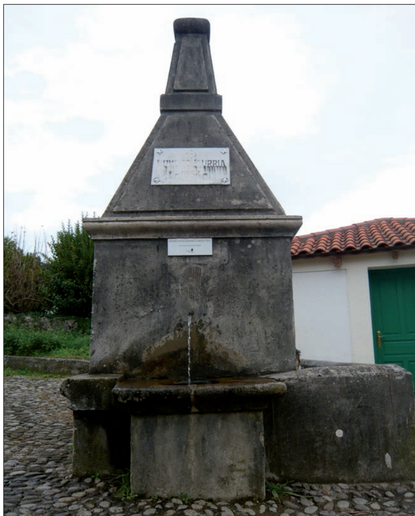
Lumoko iturria, 1884koa. Hemen abiatzen da Gernikara jaisten den bidea, nahiz guk, oraingoan, Kosnoagarakoa hobetsiko dugu.

Kontua da Errenteriak Gernika-Lumo izaten segitzen duela, ez ordea gainontzeko herriek. Eta guk jada egin dugula gure osterat