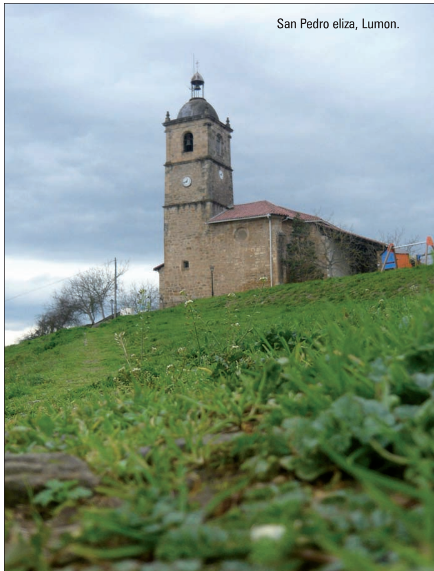
San Pedro eliza, Lumon.