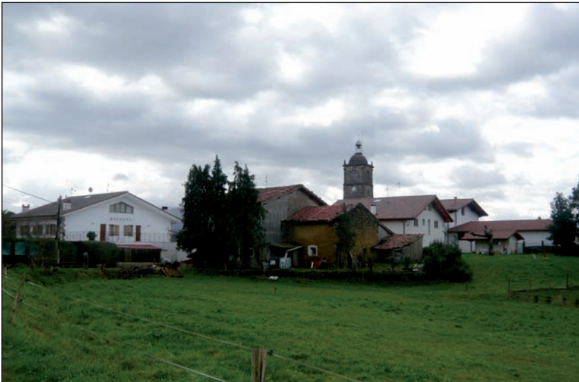
Pinudi bat zeharkatu ostean agertuko zaigu begien parean Lumoko herria.