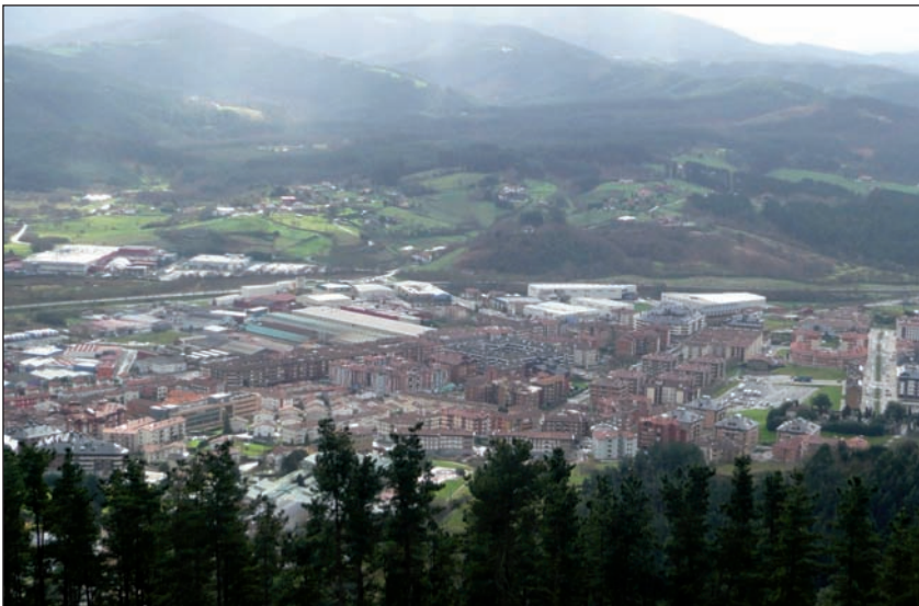
Gernika, Kosnoagatik ikusita.