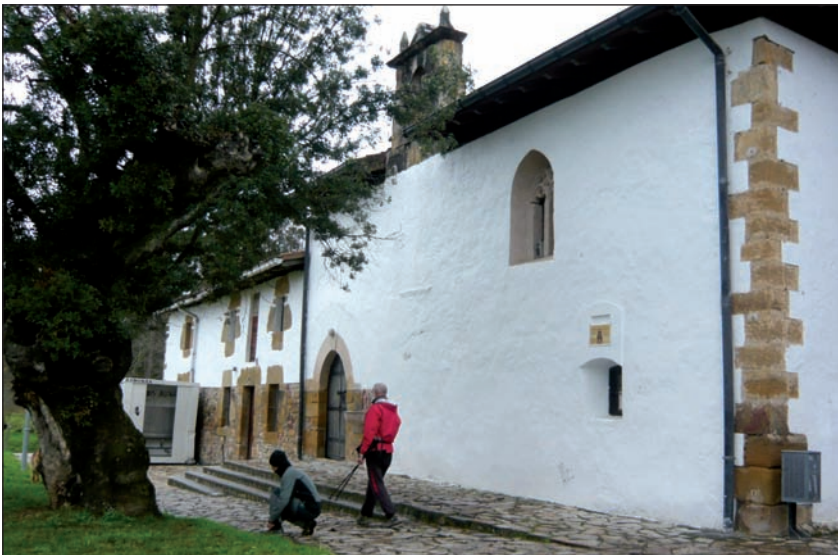
Santa Luzia ermita, ibilbidearen hasiera.