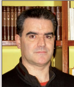
V. ZURBANO UTZIA

Oraintxe bertan Bilboko taldean ari gara gehien mugitzen; Donostian ere badago beste talde bat, baina hasi-