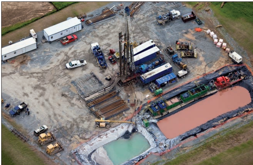
Hau sketa hidraulikoko putzu bat, Pennsylvanian.