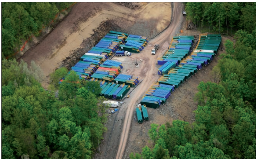
Frackingak lur azpian milioika litro ur sartzea eskatzen du. Argazkian, ura gordetzeko tegiak, AEBetako ustiategi batean.