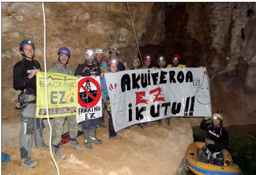
Fracking Ez Araba plataformaren ekintza bat.

gaitezen zuhurrak eta babestu ditzagun akuiferoak. Gasak ez du inora alde egingo, izango da denbora teknika seguruagoak garatzeko, baina bitartean itxaron egin behar da. Ez daukagu orain ustiatzeko premiarik, EAE ondo hornituta baitago gas naturalez”.