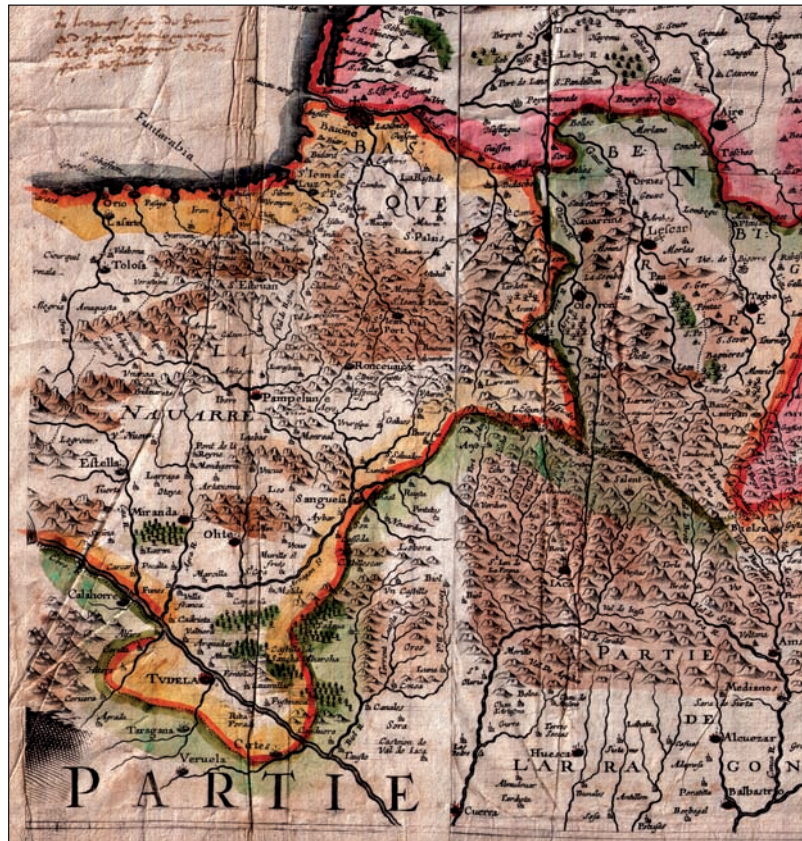
Nafarroa eta Biarnoako lurraldeak agertzen dituen 1642ko mapa, M. Tauernier-ena. Konkistatua izan ez balitz, Nafarroak edukiko lukeen irudia islatzen du nolabait.