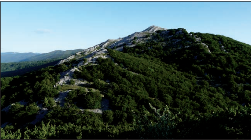
Allarteko tontorretik ikusita, Allaitz eta atzean Aratz.