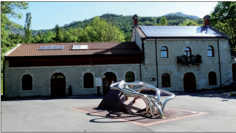
Araiako zentral hidroelektriko eraberritua.

toiko margo ikurrei jarraitzea dugu aukerarik erosoena. Garai batean, xenda ez zen hain nabarmena Aratzeko isurialde honetan. Egun, maratoia igarotzen den bidea izanik, arrastoa nabarmena da oso, lasterketa egunean ez ezik urte osoan zehar igarotzen diren mendizale eta korrikalarien eraginez... Minutu gutxian, txangoko gailurrik garaiera iritsiko gara, Aratzeko tontor nagusira (1.444 m). Ikuspegia zoratzeko modukoa da norabide guztietan: Aizkorri, Urbia, Gipuzkoako mendi nagusi guztiak, Anboto, Gorbeia, Arabako mendiak... gailurrak identifikatzen hasi eta sekula ez du batek amaitzen, egun garden horietako bat harrapatuz gero.