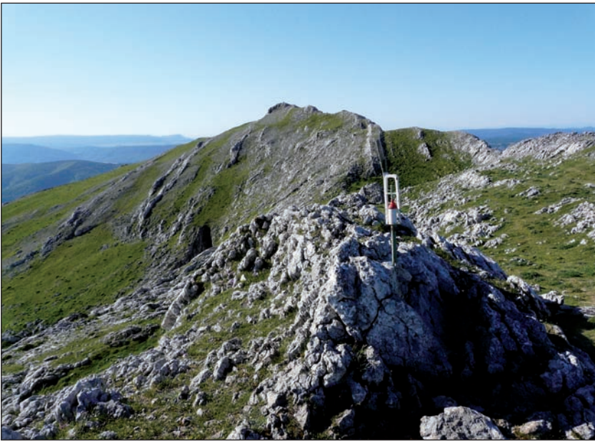
Aratz, Elurzuloak izeneko tontorretik ikusita.