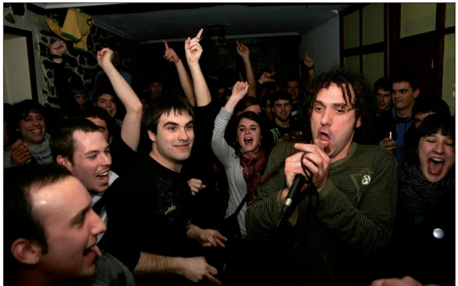
MANILLARES ITURRIAGAK UTZIAK