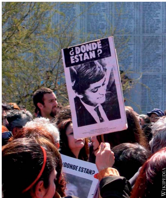
Santiagoko “Izenen Murua”-ren aurrean 2004an egindako kontzentrazioa Pinocheten diktaduran desagerrarazitakoen omenez.