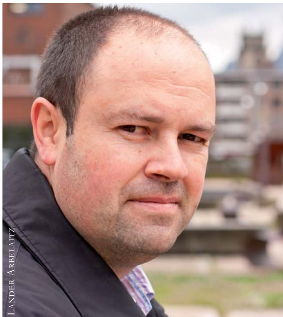
Jon Mirena Landaren ustez, Egiaren Batzordeak alde onak baino ez lizkioke ekarriko Euskal Herriari.

badugu, egia eta aitortpena lehentasun lituzkeen Komisia bultzatu behar luke euskal gizar-teak. “Hortik has gaitezke”. Justizian zein mailataraino heldu nahi den ere erabaki behar litzateke, baina Giza Eskubideetako Eusko Jaurlaritzako zuzendari ohiak dioenez, minimoa erantzukizunak argitzea da. “Nork egin duen zer, pertsonen izen abizenak. Oinarri sendo bat behar dugu aurrera egiteko”.