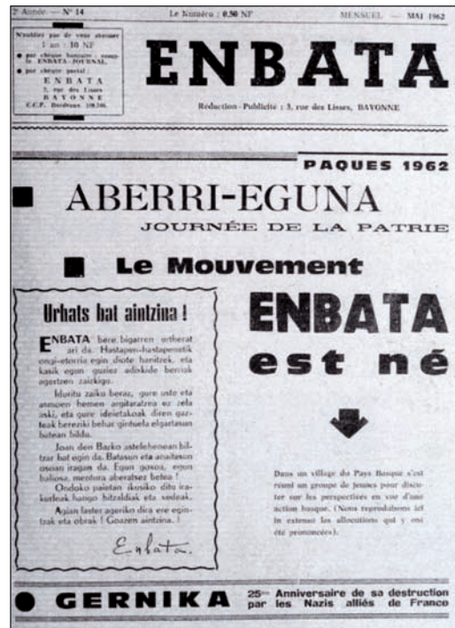
LAZKAOKO BENEDITARRREN ARTXIBOIA

etxeetan herrimina asetzen zuten ezpata-dantzari inguratuta. Ez gehiago.