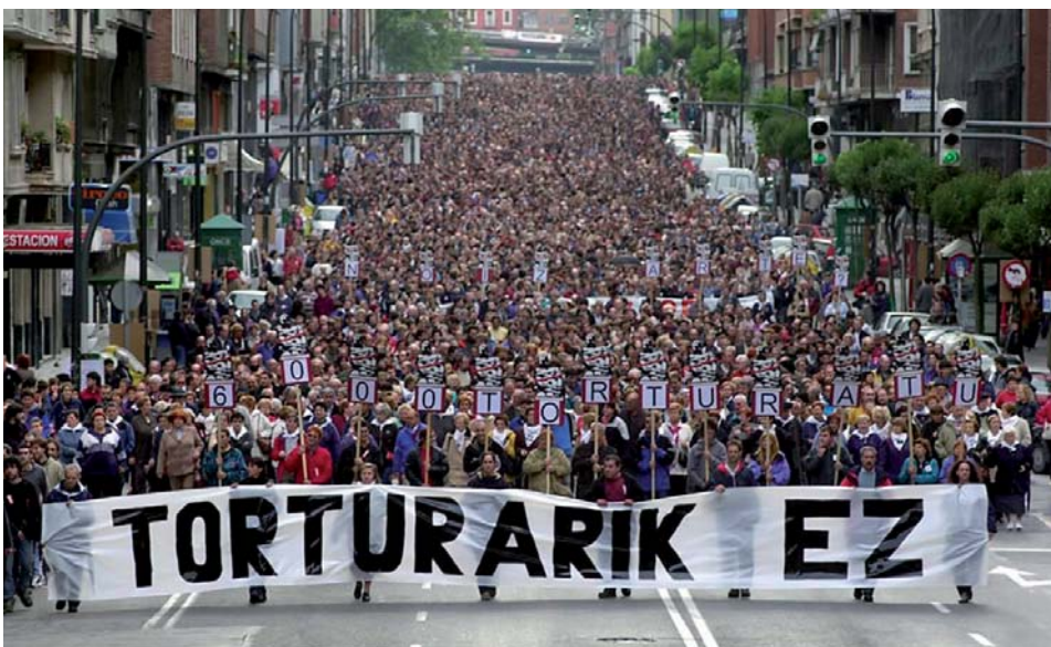
2008ko urrian Torturaren Aurkako Taldeak Bilbon egindako manifestazioa.