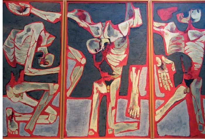
Los Torturados, Quitoko (Ekuador) Guayasamin museoa dagoen artelana.

Eta hirugarren zen Euskal Herria. Bai. Bat baino gehiago dira arrazoiak. Tortura jasan dutenak ez dira beti salaketa egitera ausartzen. Babesa dutela sentitzen dutenean, orduan bai, salatzen dute. Alboan giza eskubideen aldeko erakunde eta elkar-teak baldin badituzte, errazago jarriko dute sala-