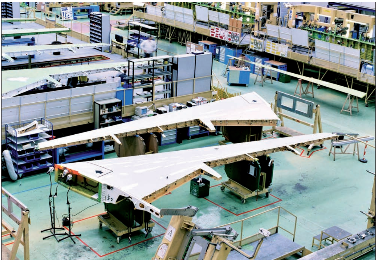
Aernova taldeko instalazioak Gasteizen; Hegan clusterreko fundatzaileetako bat da.

EUSKAL SEKTORE AERONAUTIKOA, nagusiki EAEn biltzen dena, berriro hegaldatzen eta geldialdia gainditzeko ari da, eta etorkizun ona aurreikusten da 2015era bitartean. Horixe da sektoreko arduradun nagusiek adierazi dutena. Haien arabera,