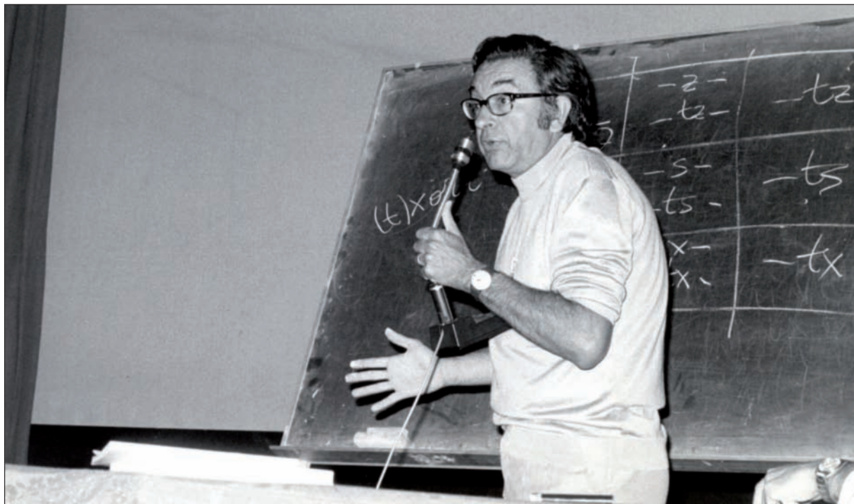
1979an Bergaran, Euskaltzaindiaren VIII. Biltzarrean.