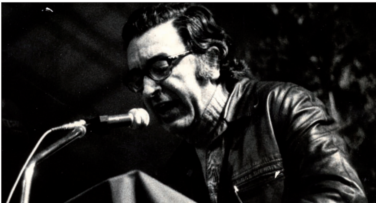
1979an Anoetan, HBren mitinean.