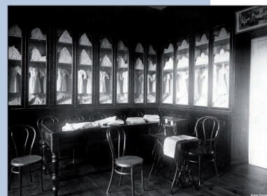
Fraisoro Etxeko hainbat ekipamendu eta “berrikuntza”. Ezkerretik eskuinera: garbitegi mekanikoa; haurren bainuontziak; hidroterapia zerbitzuko tresnak; eta arropategia eta joskintza gela.