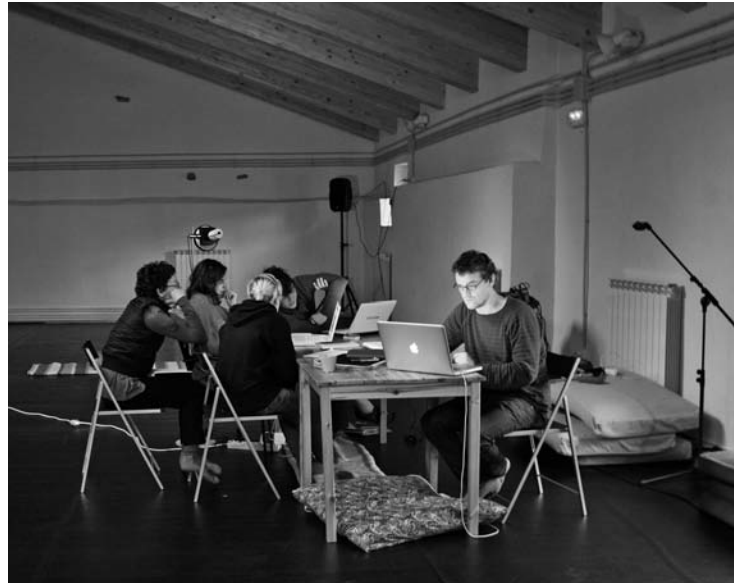
AZALA ESPAZIOAK UTZIA