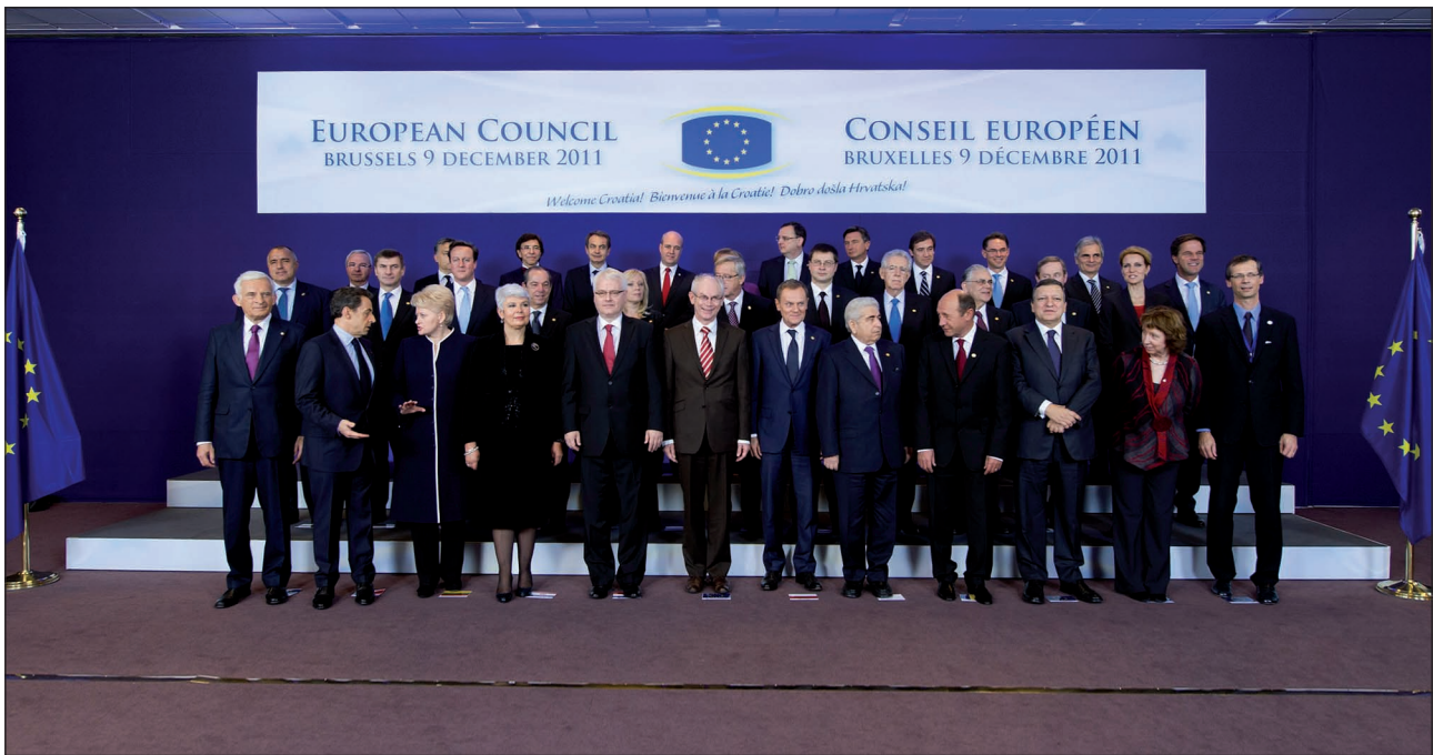
Abenduaren 9an Bruselan egindako Europako Kontseiluaren goi bilera. Batzar erabakigarritzat jo zuten askok euroaren krisiari eta oro har Europa jasaten ari den finantza astinduari aurre egiteko.

deak erabili dituztela iritzi publikoan porrot sentsazioa zabaltzeko, eta kapitalismo basatia baino beste alternatibarik ez dagoen ideia erroztzeko. Merkatu horien ase ezinezko goseari eta harrapaketari laguntzen diote horrela.