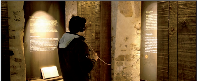
Bere omenezko museoan Joxemiel Barandiaranek jasotako hainbat kondaira bere ahotsen entzuteko aukera dago.

Esamolde ezagun batek dio herri indigena bateko zahar bat hiltzen den bakoitzean liburutegi bat desagertzen dela. Bada, Joxemiel Barandiaranek herri honen sustriak eta mitoak heriotzatik erreskatatu eta liburutegi bihurtu zituen.