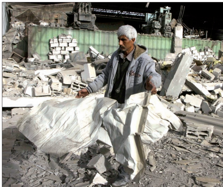
Israeli 2,8 milioi euro saldu zizkion Espainiak 2008an kohete eta misiletan. Irudian, Israelek 2008an Gazan misilez egindako bonbardaketaren biktima.

Sektorearen 2010. ekitaldiko datu ofizialik ez dago oraindik, baina ekainean edo uztaillean jakinaraziko dituztela aurreikusten da. Hala ere, Zerga Agentziaren estatistiketatik ateratako 2010eko lehen seihilekoko datu objektiboak badaude. Datu horien arabera, Espainiako Estatuak 2010eko lehen seihilekoan aurreko urteko aldi bereko arma esportazioak bikoiztu zituen, hau da, 900 milioi euro baino gehiago saldu zituen. Joera horri eutsi