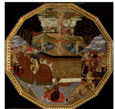
BILBOKO ARTE EDER MUSEOA