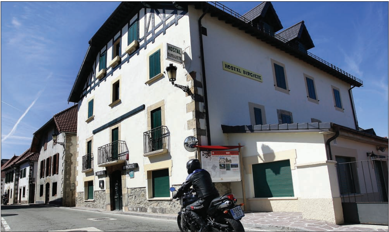
Burguete ostataua, Ernest Hemingwayren hainbat egonaldi eta piano-saioren lekuko izandakoa.

doa aiduru dituela, Auritzeko ostatuko atearen aitzinean, mando kakoletan kanpatzeko materiala, egun batzuetarako hazkurriak eta arno zahagia doazela. Eskailerak jautsi, bezperan jo zuen piano iluna ferekatu, sukaldean etxekanderea agurtu eta kabalaren kaka meta biltzen ari den palaren karrankarekin bat, “ Buenos días! ” ozena botatzen die nafar menditarrei. Behiala Kaliforniako izan ziren Zapataren edota Flores Magonen karabana matxinoan joatekoa dela pentsatuko du idazleak. Espainiako gerla galduak eta errepresio zikoitzak baina, ametsa zapuzten dizkiote. Diktadura urrina darion Auritzeko karrikari monturaren kaka freskoaren usaina gehitzen zaio. Gizonemazte gaizki armatuez oroitzen da, Nafarroakoak ez ziren beste mendi malkar haietako kobazulorako sarreran.