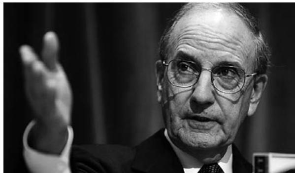
George Mitchell senataria izan zen Ipar Irlandako bitartekarien buru eta ondoren, bere izenarekin ezagun egin diren printzipioak onar zituzaten eskatu zien gatazkako alde guztiei.

Itzul gaitzen Hegoafrikara: Negoziazio prozesu konstituzionalaren lehen bilera formala World Trade Centre eraikinean egin zen, Johannesburgetik gertu, 1991ko azaroan. Bileraren helburu nagusia negoziazio egituraren lehen osoko bilkura prestatzea izan zen. Lehen osoko bilkura horri Codesa esaten zaio ( Convention for a Democratic South Africa edo Hegoafrika Demokratikorako Biltzarra). Afera nagusia erabakiak hartzeko Codesa zertan oinarrituko zen erabakitzea zen. Gomendioa “nahikoa adostasun” egon beharko lukeela izan zen. Ekitaldi publiko horren zeregina pro-