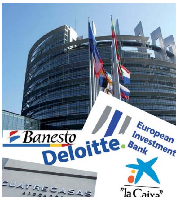
EIBren egoitza nagusia Luxenburgon.

EIBrekin sinatutako kontratuaren anexoetan proiektuaren deskripzio teknikoa azaltzen da, eta bertan konpost planta bakarra aurreikusten dute, urtean 7.000 tona hondakin konpostatzeko gaitasuneko. Beraz, Gipuzkoako hondakinen planean azaltzen diren gainerako bi konpost plantak ez dira egingo. Gaur egun martxan dagoen planta bakarra Azpeitiko Lapatxekoa da; 2.500 tona hondakin jasotzeko gaitasuna du, baina 2010ean 4.000 tona jaso ziren, batez ere organikoa atez ate