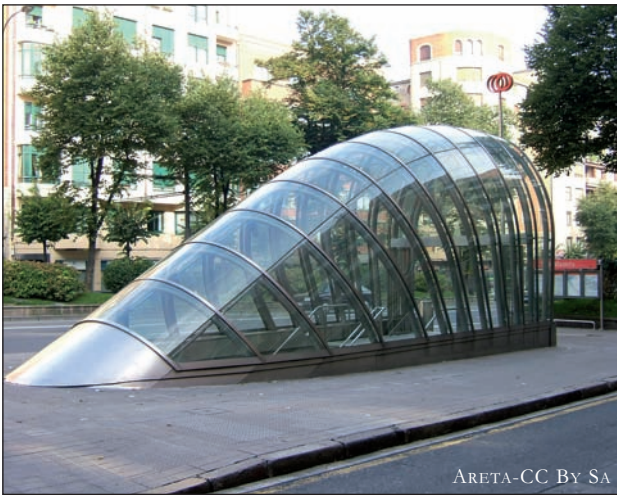
ARETA-CC. By SA

Beste ikono bat: fosterittoa. Hiriaren eraldaketaren hasiera Metroaren inaugurazioa izan zen, zenbaiten ustez.