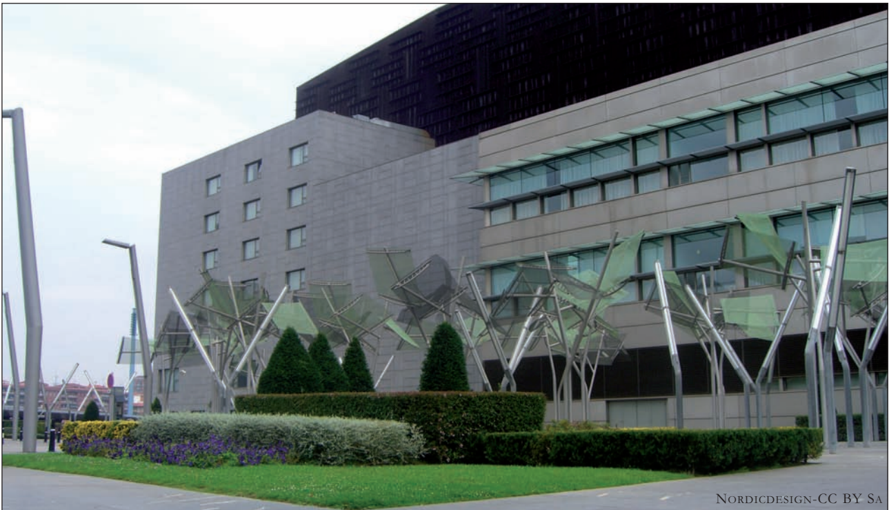
NORDICDESIGN-CC BY SA

Hala da oraindik, transformazioa ez baita burutu, etengabe gauzaten ari da azken hiru hamarkadetan. Lerro hauek idazteko unean kasik, Garellanoko ingurua eraldatzeko planen berri eman du Bilbao Ría 2000k, 1992an erakunde publikoek sortutako sozietate anonimoak. Haren eskutik etorri dira Bilbori aurpegia aldatu dioten ekintza gehienak. Iragan industrialak utzitako espazioak eraldatzeaz arduratzen da elkarteak, haien lekuan plaza, parke, auzune, azpiegiturak... jarrita. Lan eskerga: iragan industrialak utzitako espazio oso handia da Bilbon eta inguruko hirietan.