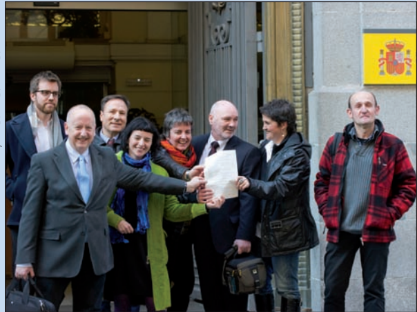
Sortu alderdiaren inskripzio eskaera Madrilan.

Agidanez, poliziek ez dute frogarik, analisi hutsak baizik –hori salatu du Demokraziarako Epaileak (JpD) elkarteak–. Ikusteko dago Auzitegi Gorenak botoi gorria sakatuko duenentz. Iniciativa Internacjonalistarekin sakatu zuen, eta Konstituzio Auzitegiak zaplazteko ederra eman zion. Arriskatuko al da berriz ere beste zaplazteko bat jasotzera?