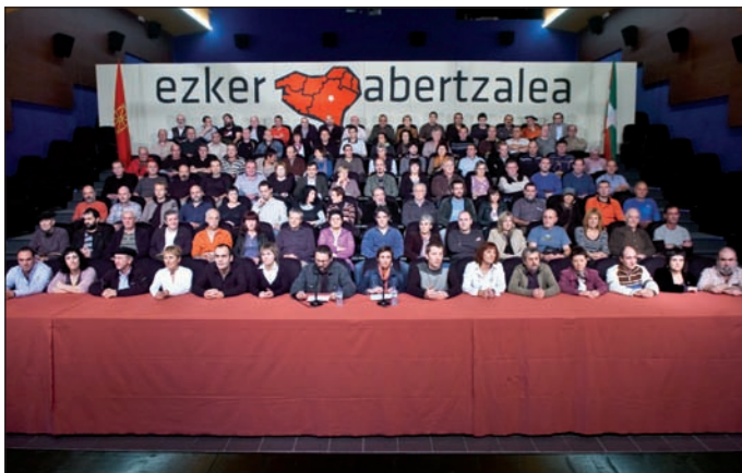
ARGAZKI PRESS / JUANAN RUIZ