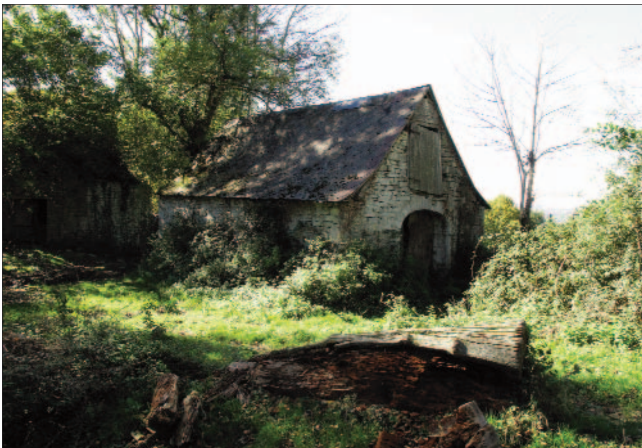
Lojagaraiko bordak, galdutako gizarte baten lekuko isilak.

eta berehalaxe, maldaren gora egin beharko dugu, soro bat inguratzen duen burdina-hesiari jarraituz. Hegi bizkarrera heldu ondoan, eskuinera joko dugu, hortxe baita Ahargo gailurra (609 m). Nolanahi ere, honi huts egiterik ez da, atanda-harria (mapa-harria) baitago hantxe. Erabat egokia da atanda-harri hau hemen egotea, egundoko ikusmen zabalaz oparitzen gaituelako gailur xumeak. Honetaz ohartzeko, nahikoa da jakitea ekialdean Bigorrako Egurdimenditik mendebaldean Lapurdiko Urtsumendira ematen duela bistak, tartean dauden Bigorra, Biarno, Zuberoa, Nafarroa, Baxenabarre eta Lapurdiko mendi gehien-gehienak ezagutuko ditugarik. Ahargo gainerik beti, burdinazko gurutze bat jarrita dagoen aldetik, Biarno eta Landetako lautadak ere ikusiko ditugu.