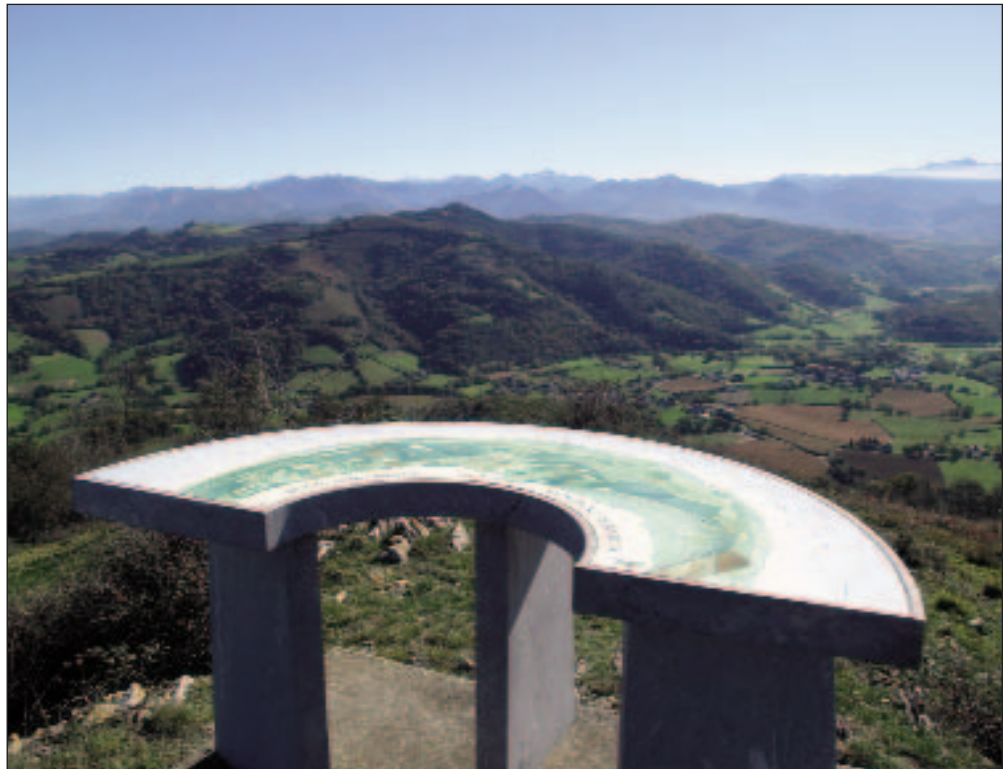
Barkoxeko Ahargo mendixkaren gailurretik ikusmen oso zabala eta ederra dago. Beheko aldean, hurbilenean, Barkoxe herria da.