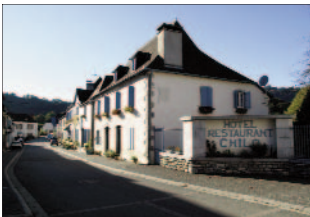
Bürgia auzoan da Xilo ostatu-jatetxe ospetsua.

tu txikia hartuko baitugu jarraian, 'Ahargo 8' seinaleak gomendatuko digun bezala.