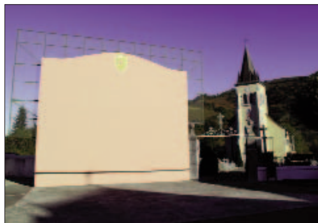
Barkoxeko arrabotea eta eliza.

Bide txiki horretara heltzean ezker aldera hartuko dugu. Eskuin aldera hartu bagenu, paradisura iritsiko ginatkeen alta... edo, zehatzago esanda, Paradis izeneko etxera. Paradis(uar)i bizkarra emanda beraz, Maidalenako etxauetara eta hemendik Atharratzera ere darman bidearekin topo egingo dugu. Hementxe ezkererantz joko dugu; eskuin aldera joanda topatuko genituzke Maltako baseliza eta Txapela auzoko eskola ohia. Nahiz eta ibilgailuentzako bidea izan, goxo izango zaigu honetan ibiltzea, hainbat laborari etxeri agur eginda. Montorirako bidearen sardan, zuzen jarraituko dugu Bürgia izeneko auzora heltzeko gisan. Mauletik datorren bidearekin topo egin eta laster, Euskal Herri orotan eta askoz urrunago ere ospetsua den Xilo ostatu-jatetxearen aitzinean pasatuko gara. Diru apurtxo bat kostako bazaigu