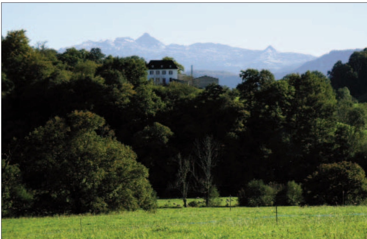
Barkoxeko laborari etxe dotorea. Urrunean, Ahüimendi (ezkerrean) eta Arlatze (eskuinean).

tan. Zuhaitzen artean, Barkoxeko eliza inguruko eta Bürgia auzoko etxeak ikusiko ditugu, baita etxe multzo nagusi horietatik aldenduak diren baserri ugari, Gaztelondokoa, Maidalenakoak eta Txapelakoa, esaterako. Zuberoan, eliza ingurutik edo karrika nagusitik aldenduak diren auzoei etxauak deitzen diegu.