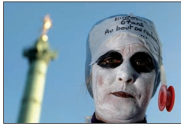
Protestak Frantzian, erretretak erreformatzearen kontra.

geroago pentsioen erreformak Asanblea Nazionalaren onarpena izan zuen, UMP eskuindarraren gehiengo absolutuari esker.