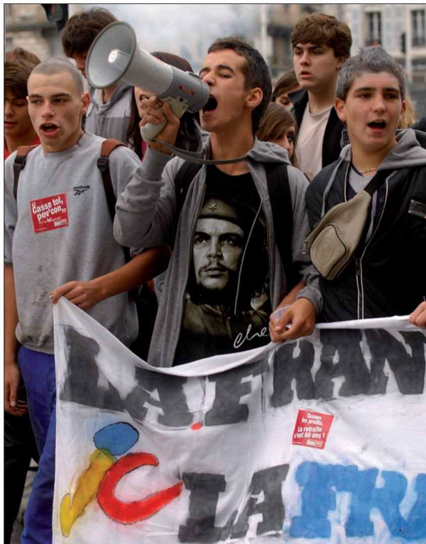
Lizeotako ikasleak erretreten erreformaren kontra manifestatzen Baionan.

“LE VIEILLISSEMENT ne peut pas se contourner, il faut l'assumer” (Zahartzea ezin da eragotzi, onartu beharra dugu). Esaldi horrekin iragarri zuen ekainaren 16an Eric Woerth Frantziako Lan ministroak erretreta atzeratzeko erreforma. Beste kontu batzuen artean, Sarkozyk 60 urtetik 62ra igoko du erretiroa hartzeko urtea, pentsioa osorik kobratzeko kotizatu beharreko urte kopurua ere handitu egingo da 2012tik aurrera: 41 urte. Eta hala egiten ez duenak 67 urterekin jaso ahal izango du pentsio osoa, lehenago 65 urteren aldean. Funtsean, diru gutxiago eta lan gehiago eskaini die frantziarrei Gobernuak,