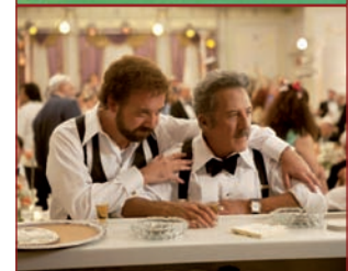
Barney's Version , publikoaren gustukoena.

www.argia.com/zinemaldia-2010 helbidean, aurtengo Zinemaldiko pelikulen kritikak ikusgai.