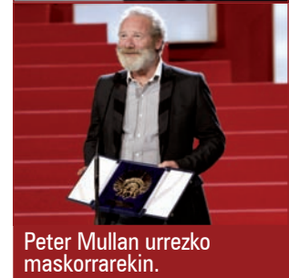
Peter Mullan urrezko maskorreakin.