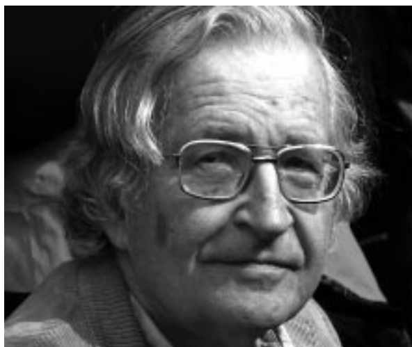
Noam Chomsky da nazioarteko komunitate zientifikoan autorerik aipatuena.

“ N ola izango dira garrantzitsuak prozesuak, garrantzitsuak emaitzak dira! Prozesuak garrantzitsuak dira, emaitza onak ekartzen badituzte. Ez dut irudikatzen inor joaten denik bihotzeko ebakuntza egitera pentsatuz ‘ez, garrantzitsua prozesua da, ez emaitza’”