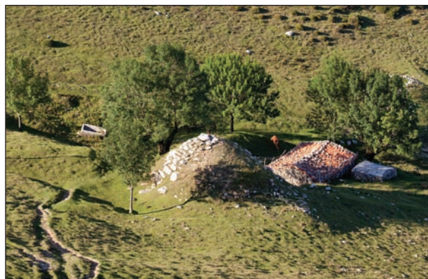
Eskubian, goian: Aittolarako bidean dago ostatua, Azkoitik etorrita Olason barrena datorren pistak Otarrerakoarekin bat egiten duen lekuan. Eskubian, behean: elurzuloa Arrateko-sakonaren inguruetan. 80 urte dira bertan inor ez dela ari lanean.

tutako txabola bat ageri da sakonaren sabelean, eta ezkerrean, putzu bat. Marikutzen zaude, eta egin beharra duzu. Hartu harri bat eta bota, zeharka dezala aire garbia, ahalegin-putzuaren beste aldera iristen. Alferrik. Sakabik bezala, bide honetatik igaro diren gizon-emakumeek urteetan egin duten bezala, botako duzu, indarrez sobran jaurti ere, baina ez zara beste muturrera helduko. Neur ezazu oina erabiliz: 75 urrats da luze. Putzua zaintzen, gainez gain, Neolitikoko bitumulu, 1958an aurkitu zirenak zientziarako. Ele zaharrek diotenez, harriak beharrez ontzurreak botatakoak badira, orain norbaitek jaso zain daudenak Marikutzeko lokatzetan, urpean ehortziak.