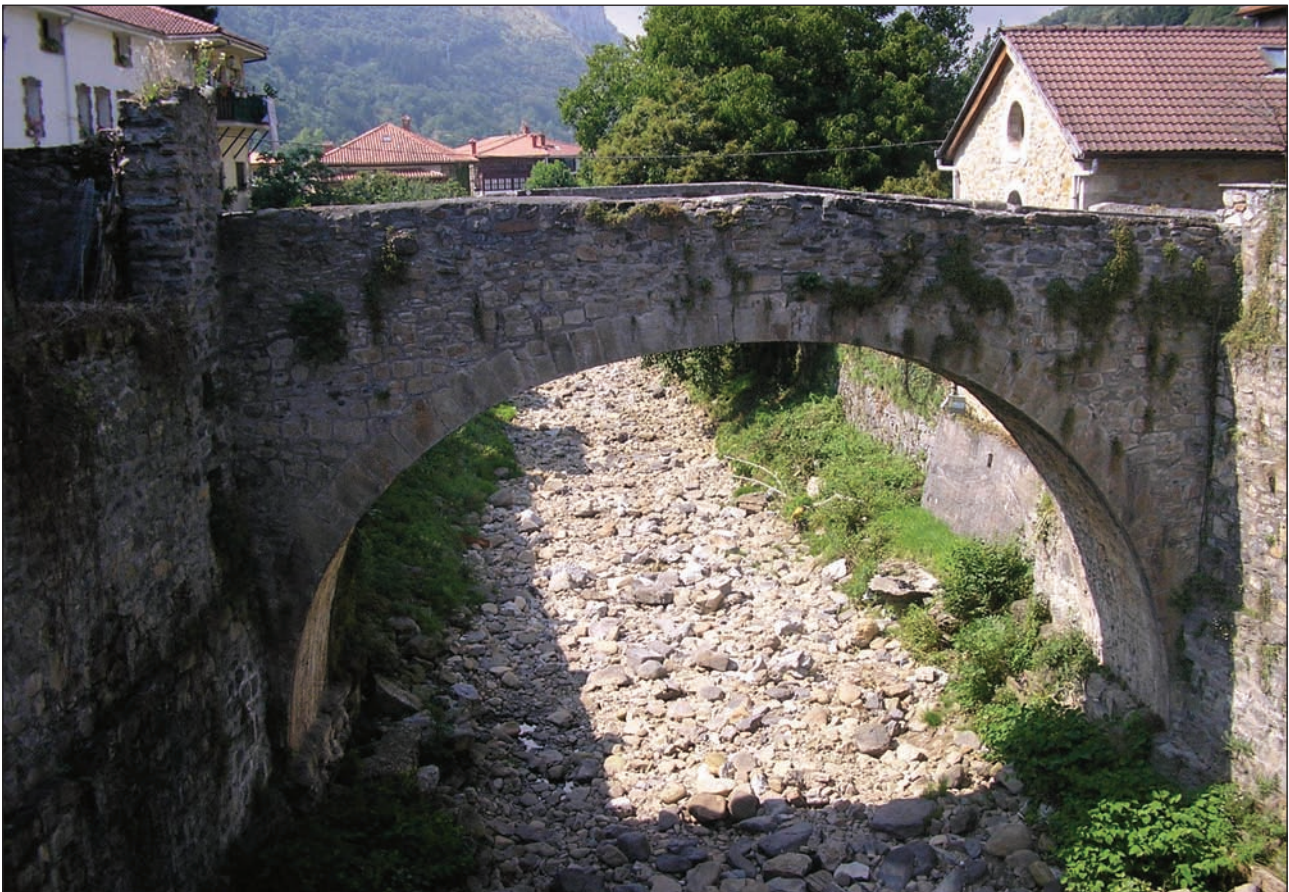
Zubi Zaharra, Calera ibaiaren ubidearen gainean. Uda oro gututz lehortzen da Calera, ura lurzoruak xurgatzen du eta.

behin kalejira amaituta, Plaza Berrian. Hortxe elkartzen dira herritarrak hitzordu garrantzitsuetan.