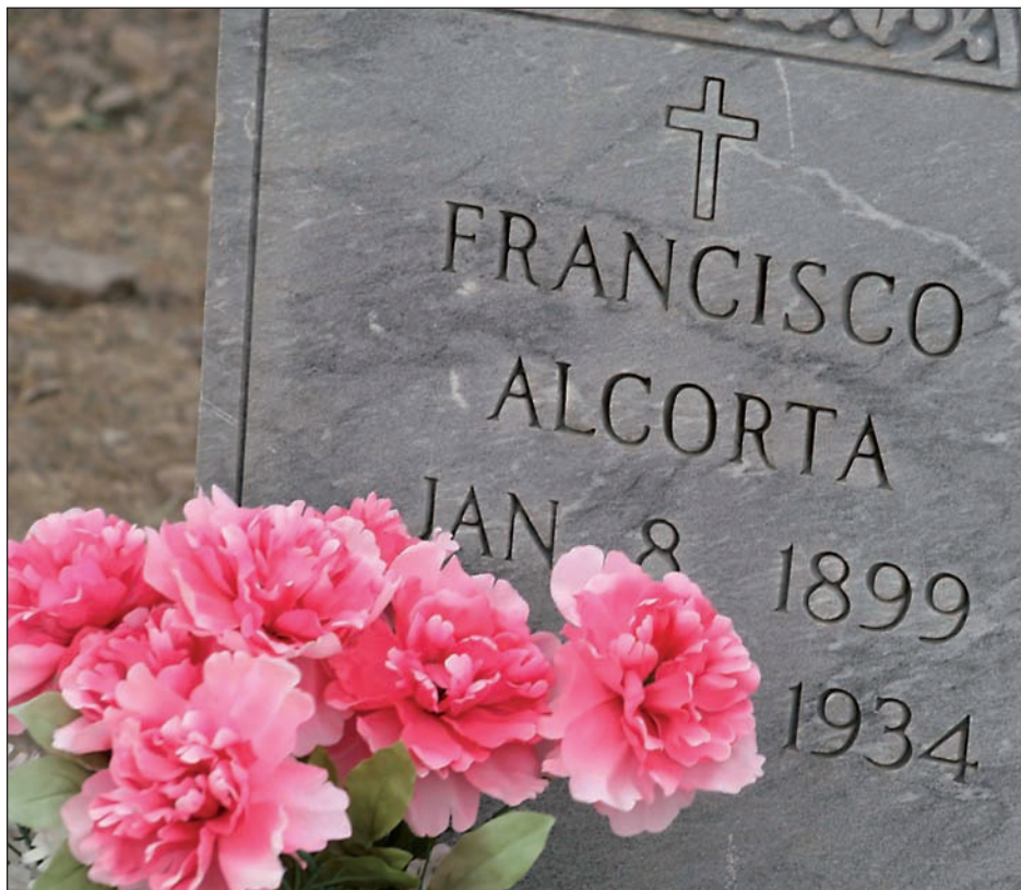
AEBetako Mendebaldeko euskaldun baten hilarria.