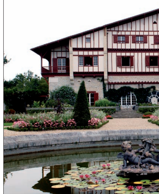
Ezkerreko argazkian, Errobi ibaia eta Ursuia mendia, Abbé Pierre ikustokitik. Erdikoan, Arnaga, Edmond Rostandek egindako etxea, gaur erakustoki bihurtua.

eritasunetan berezituriko hamazazpi sendaetxe ditu. Hots, osasunaren saila ekonomikoki baitezpadakoa zaio, mila lanpostu zuzen izanez. Hori dela eta, ez zaitezte harri karriz karriz zabiltzatela bat baino gehiago ikusten baduzue orgatto bati tiraka. Jende horiek maleta utzirik daukate hotelean ala erietxean. Tramankulu txirringadunak oxigeno botila daramakie.