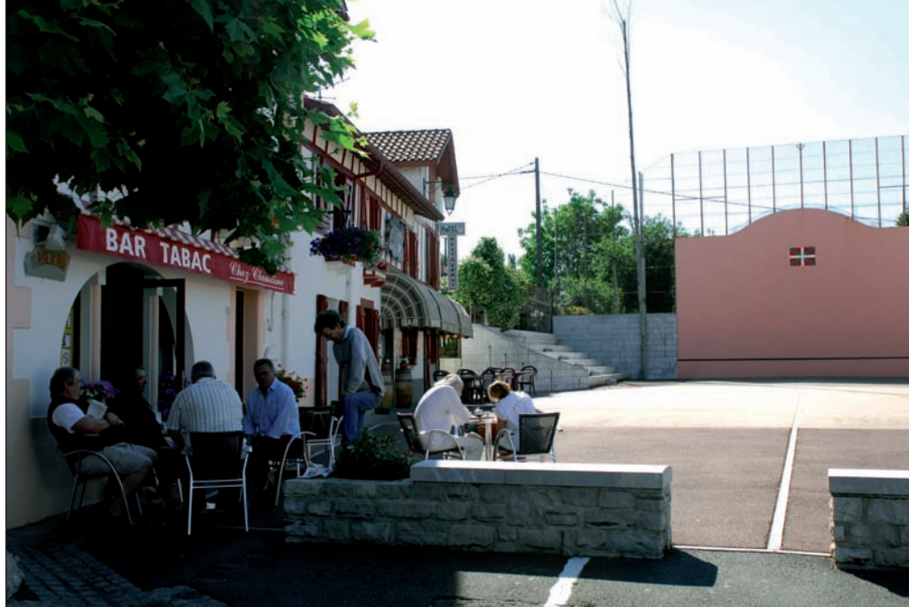
Pilotalekua eta ostatuak, Kanbo Beherea auzoan.