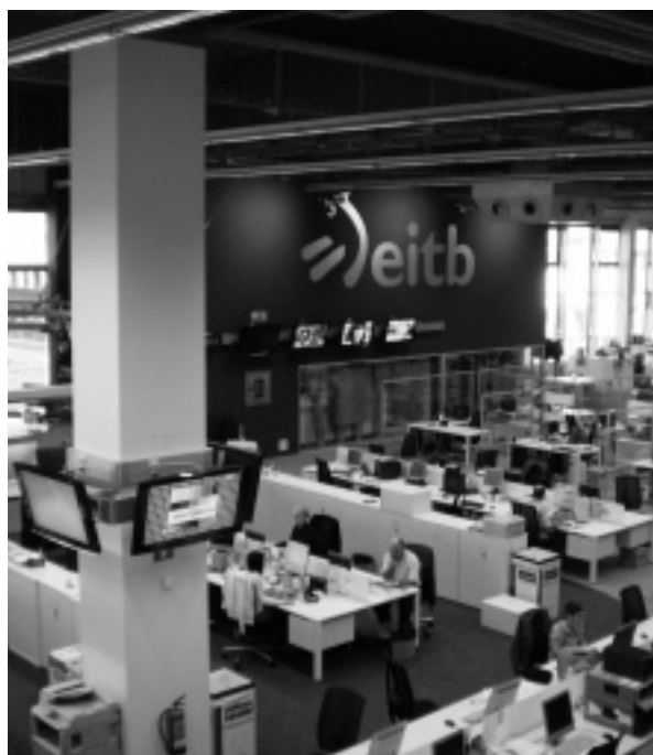
EITBren egoitza nagusia Bilbon.

EITBri dagokionez, nabarmena da batzuek nahiko luketen normaltasuna irudikatzeko ahalegina. Eztabaida eta parte hartze politikoa modu esanguratsuan murriztu dira, haren ordez banalitatea ezarriz. Horrekin, euskal gizarteak behar duen eztabaida publikoa ukatzeaz gain, EITBren sorrera legeari berari egiten zaio iruzurra (izan ere lege horrek parte hartze politikoa eta euskara zein euskal kulturaren sustapena jartzen baititu medio publikoen helburutzat, inon agertzen ez delarik entretenimendua helburu gisa). Erreferentzia eremua, gero eta nabarmenago, Espainia da, eta digitalizazioa baliatu dute, Lópezek eta Sanzek eskuz esku, Nafarroatik ETB desagertarazteko.