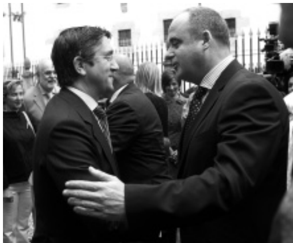
Lópezek Gobernua eta EAJ legealdian hurbilduko direnentz, ezbaian izan zen.

A. ITURRIOTZ. Baina hemen ez gara ari Batasunaren estrategiaz, Gobernu honen legitimitateaz baizik.