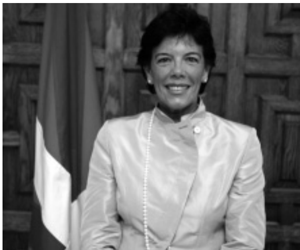
Isabel Celáa, Hezkuntza sailburua.

tute. Errealitate horren aurrean, esanguratsuak izan dira irakaskuntza arloko CCOO sindikatuko buruzagiak –sindikatu honetako pisuzko kideek aldi berriko Hezkuntza sailaren gunegorria osatzen dute– El Mundo egunkarian zioena: “Urteetako joerari buelta emateko denbora behar da”. Ez ziren, bada, familien nahiak eta aintzat hartu behar? Ala, nahi horiek baldintzatzea, aldatzea da nahi eta bilatzen dena?