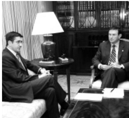
Ajuria Eneak lehendakari abertzale bati eman zion ostatu hogeita hamar urtez. Iaz maizterrez aldatu zen.

“Guzti hau oraindik garbiago azaltzen da gobernu berriaren oinarrian dagoen akordioaren beste gai garrantzitsuari begiratzen bazaio: ETaren indarkeriaren kontra borrokatzeko borondateari eta biktimen oroimena zaintzeari. ETaren terroreak biktimak sortu ditu Euskal Herriaren lurraldetasuna eta autodeterminazio eskubidea gauzatu ahal izateko, hau da, euskal gizartea ulertzeko modu bat indarrez gauzatzeko”