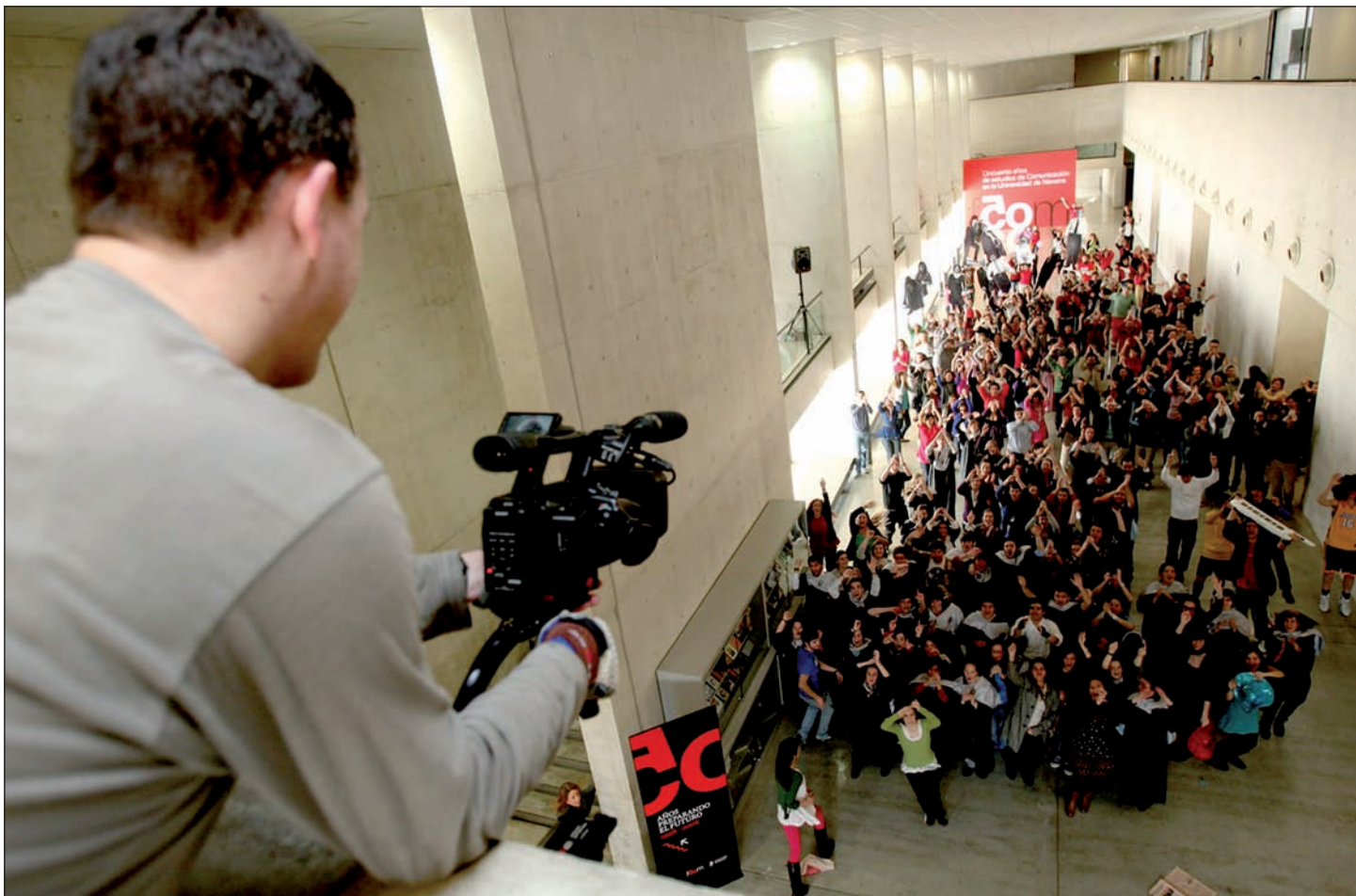
Goiko irudian, Nafarroako Unibertsitatean grabatutako LipDuba. 400 lagun ingururekin, orain arte egin den handiena da.