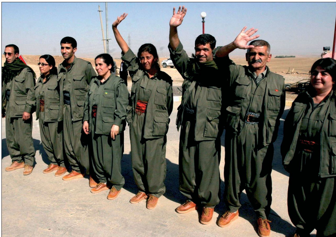
PKK-ko gerlariak Irak eta Turkiaren arteko muga zeharkatu ondoren, joan den urrian.

Turkiar eta kurduen artean inoiz ikusi gabeko urratsak eman ziren bakea lortzeko 2009an. Baina abenduan herio-kolpea jasan ondoren, prozesuak hila dirudi sartu berri den 2010ean.