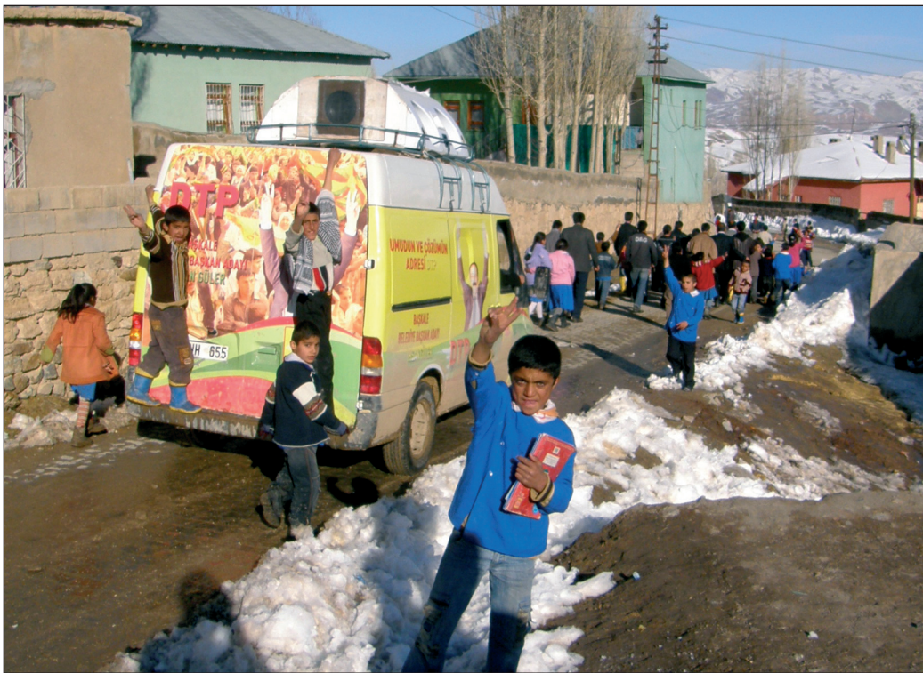
DTPren hauteskunde kanpaina arrakastatsua ospatzen.

zela abisatzen zuen Öcalanek Imraliko pre-sondegitik.