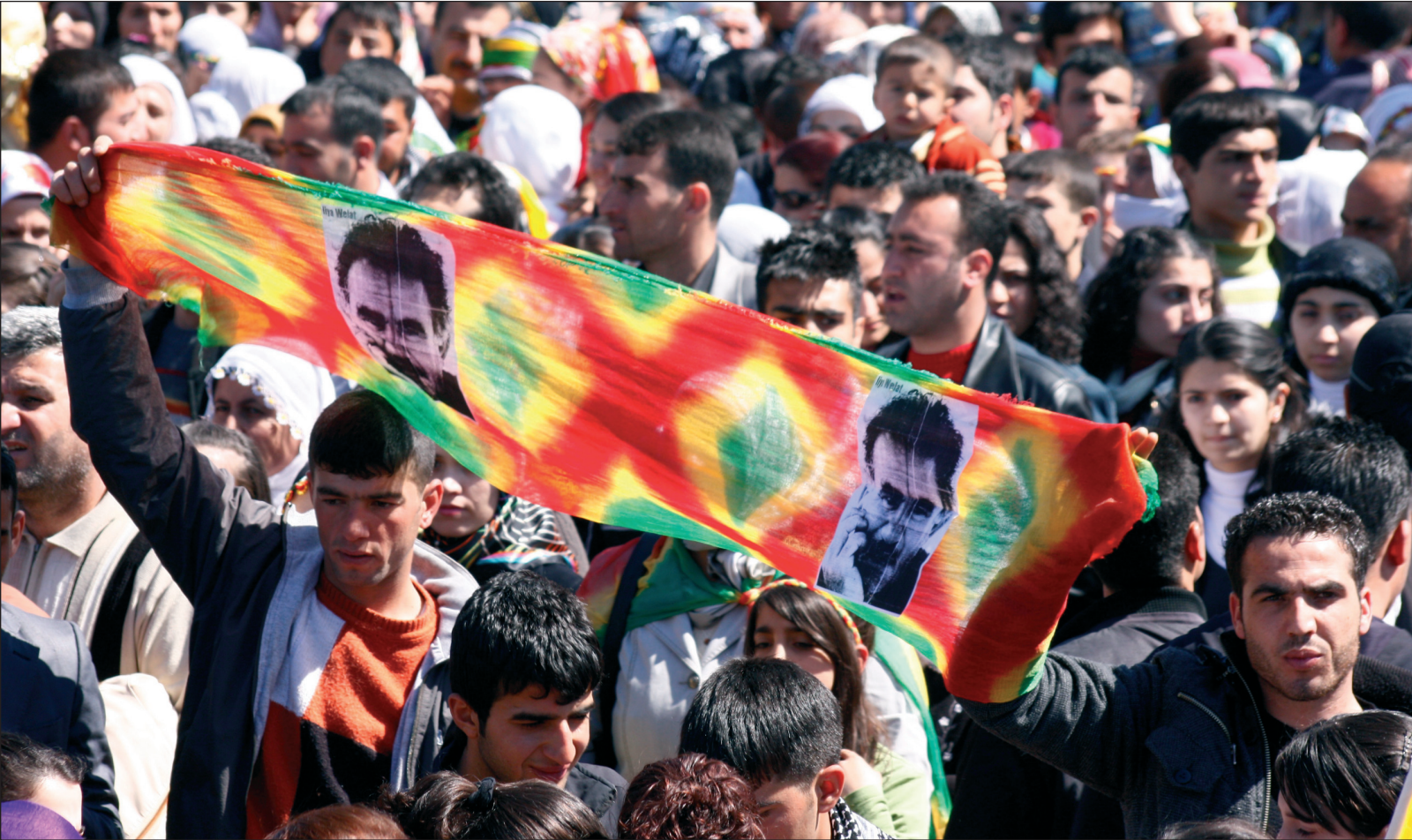
Abdullah Öcalanen aldeko manifestaldi bat Ipar Kurdistanen.