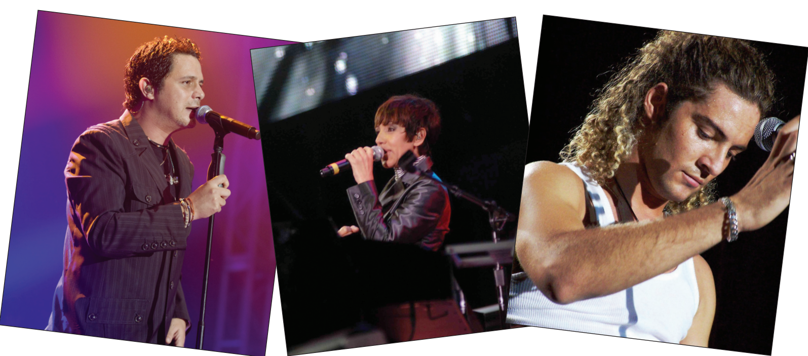
Ezkerretik eskumara, Alejandro Sanz, Ana Torroja, David Bisbal, Marta Sanchez, Mikel Erentxun eta Sergio Dalma. Denek dute ospe eta izenik gabeko musikari profesional saldo ederra atzean.